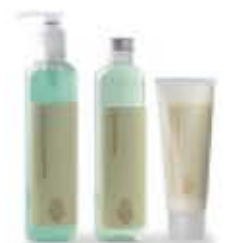
gli articoli da toilette pipercikkek