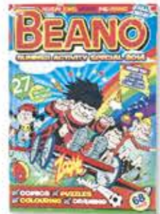
il giornalino a fumetti képregény