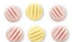
la mentina mentolos cukor