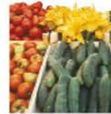
la verdura zöldség