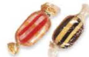
le caramelle cukorkák