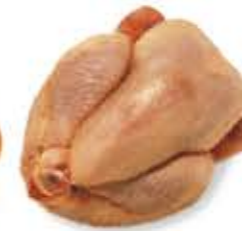
la carne e il pollame hús- és hentesáru