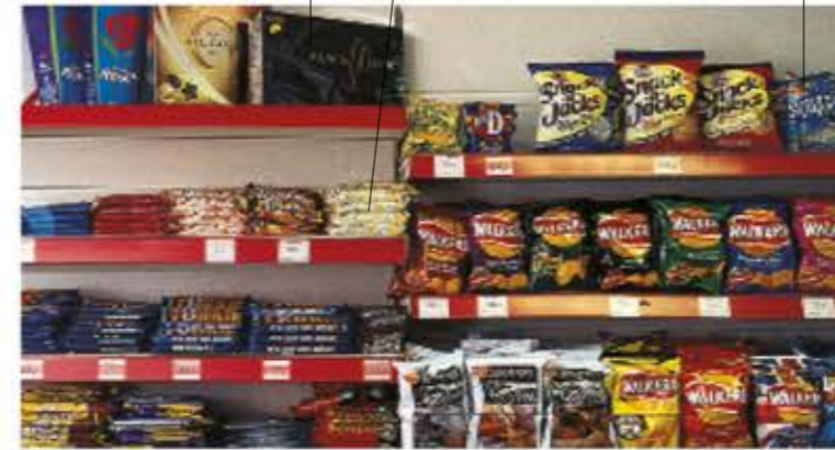
il negozio di dolciumi | édességbolt