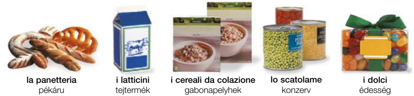
la panetteria pékáru