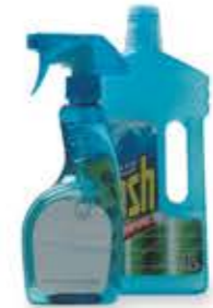
i casalinghi háztartási cikkek