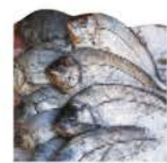
il pesce hal