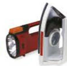
gli articoli elettrici elektromos cikkek