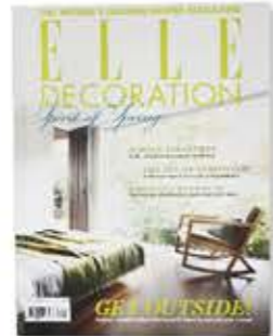
la rivista magazin