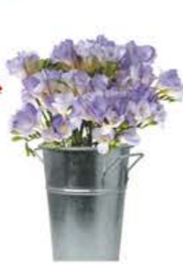
la fresia frézia