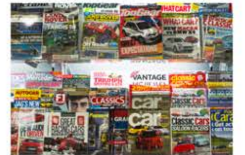
le riviste | magazinok