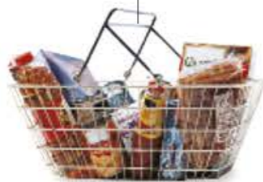
il cestino kosár