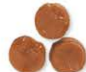
la caramella mou karamella