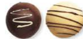
il cioccolatino praliné