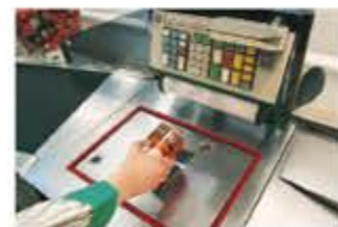
il lettore ottico leolvasó