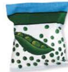
i surgelati mélyhűtött élelmiszer