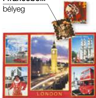
la cartolina képeslap