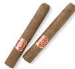
il sigaro szivar