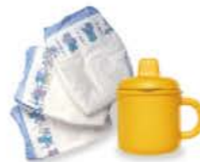
i prodotti per bambini babaápolási cikkek