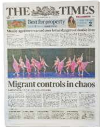
il giornale újság