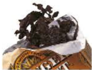
il tabacco dohány