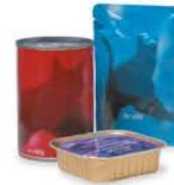
il cibo per animali állateledel