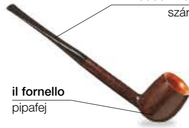
la pipa pipa