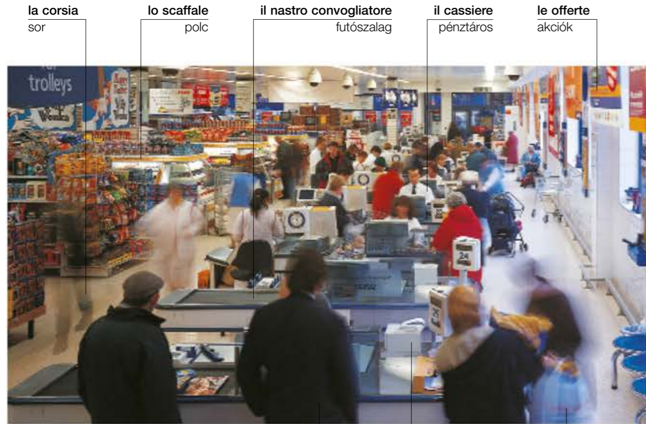
la corsia sor