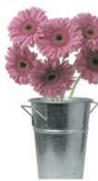
la gerbera gerbera