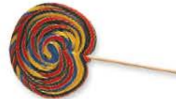
il lecca lecca nyalóka