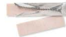
la gomma da masticare rágógumi