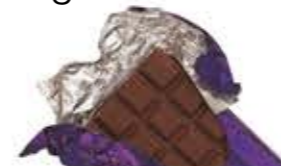
la tavoletta di cioccolata tábla csokoládé