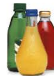
le bibite italok