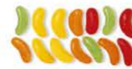
la caramella di gelatina zselés cukor