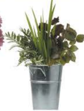
il fogliame zöldnövény