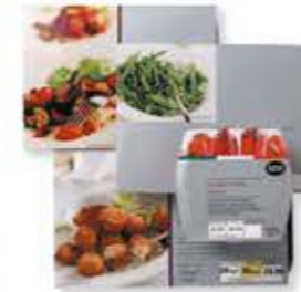
i precotti félkész étel