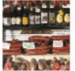
la salumeria csemegeáru