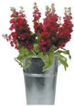
la violacciocca viola