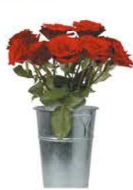
la rosa rózsa