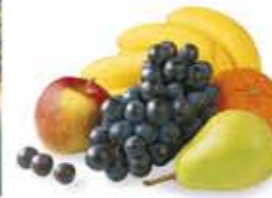
la frutta gyümölcs